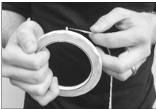
Incorrect Roll Out